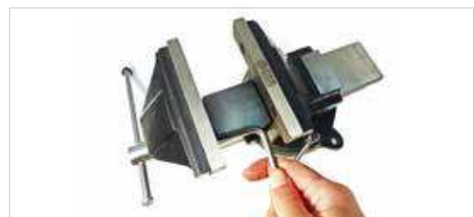
Machoirs acier démontables Removable steel jaws