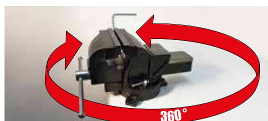
Base pivotante à 360° Swivel base at 360°